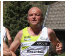
25 Jahre mit dabei